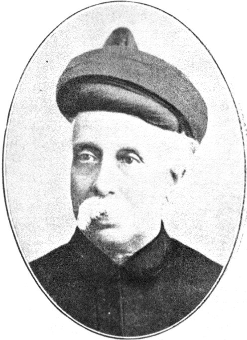
डॉ. आत्माराम पांडुरंग